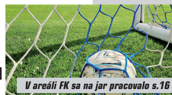
V areáli FK sa na jar pracovalo s.16