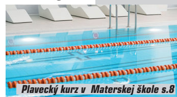
Plavecký kurz v Materskej škole s.8

Výstup na Šíp prilákal množstvo turistov s.16