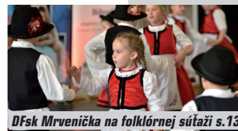
DFsk Mrvenička na folklórnej súťaži s.13