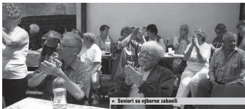
» Seniori sa výborne zabavili