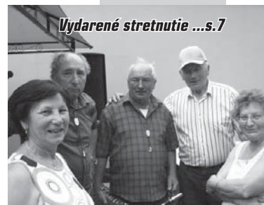
Vydarené stretnutie ...s.7