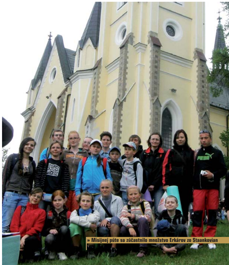
» Misijnej púte sa zúčastnilo množstvo Erkárov zo Stankovian