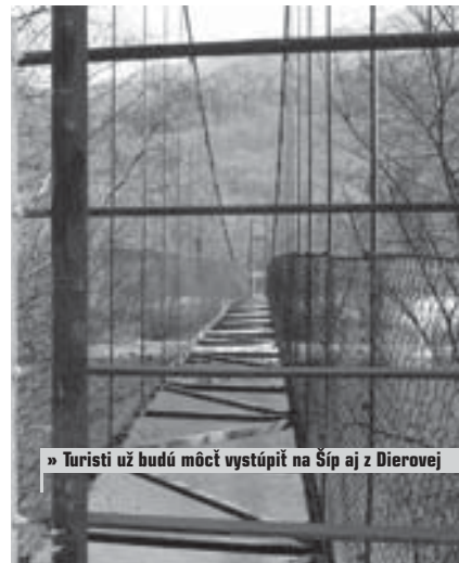
» Turisti už budú môcť vystúpiť na Šíp aj z Dierovej