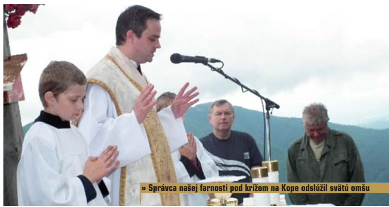
» Správca našej farnosti pod krížom na Kope odslúžil svätú omšu