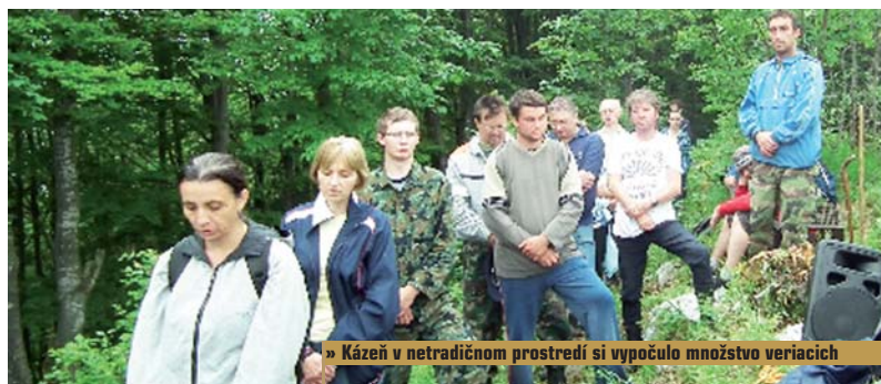
» Kázeň v netradičnom prostredí si vypočulo množstvo veriacich