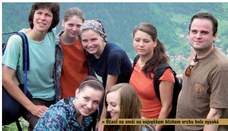
» Účast na omši na najvyššom blízkom vrchu bola vysoká