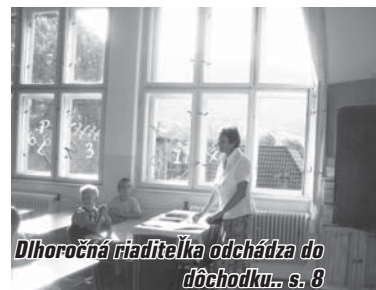
Dlhoročná riaditeľka odchádza do dôchodku... s. 8