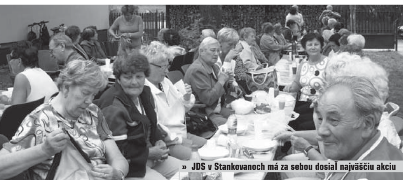
» JDS v Stankovanoch má za sebou dosiaľ najväčšiu akciu