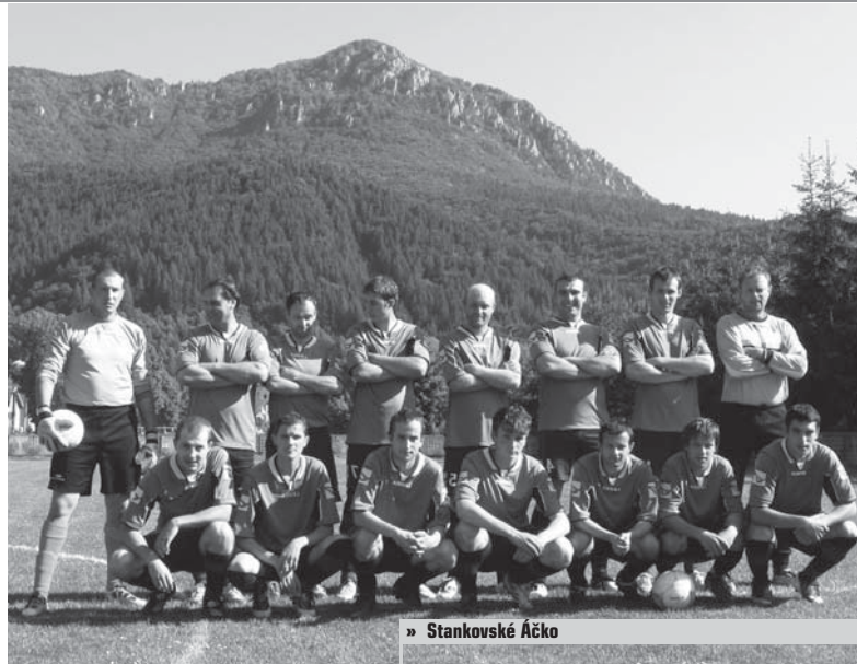
» Stankovské Áčko