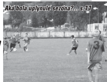
Aká bola uplynulá sezóna?... s.11