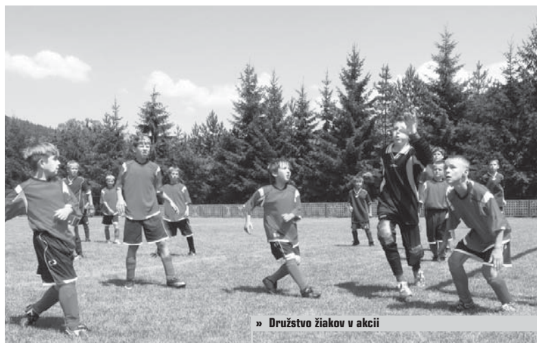
» Družstvo žiakov v akcii