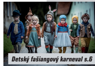
Detský fašiangový karneval s.6