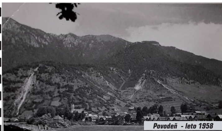
Povodeň - leto 1958