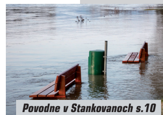
Povodne v Stankovanoch s.10