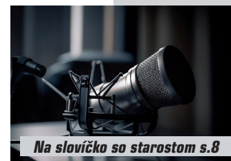
Na slovíčko so starostom s.8