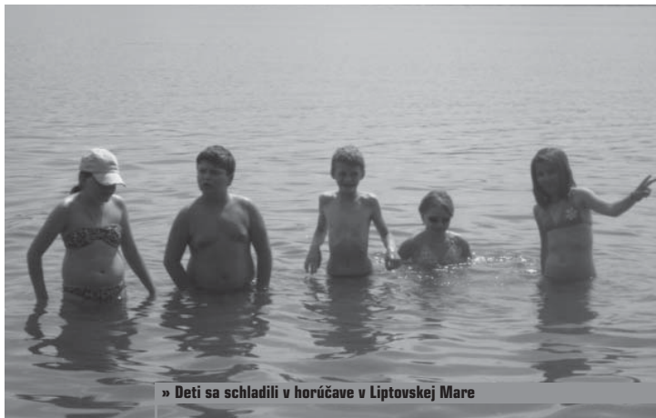
» Deti sa schladili v horúčave v Liptovskej Mare