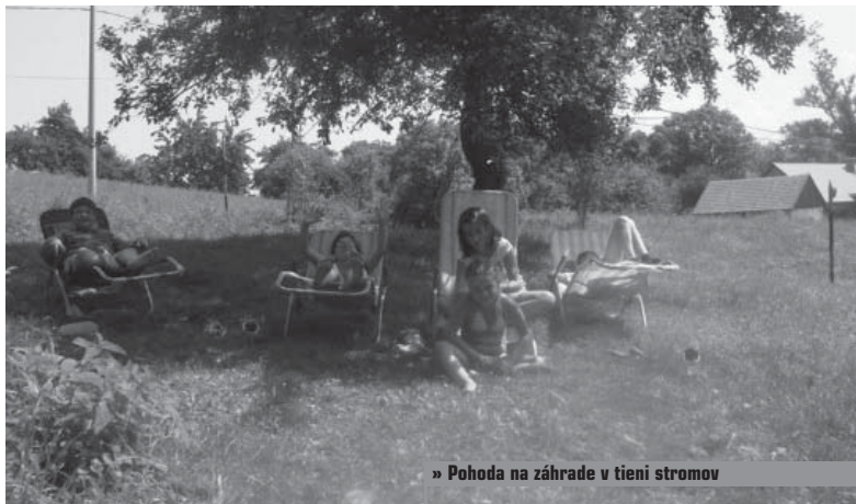
» Pohoda na záhrade v tieni stromov