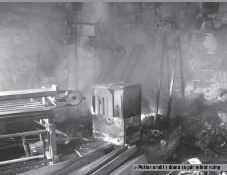
» Požiar urobí z domu za pár minút ruiny