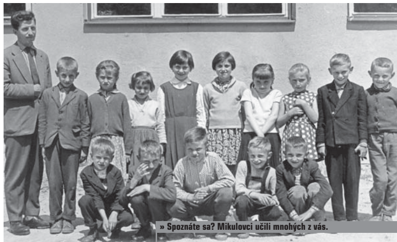
» Spoznáte sa? Mikulovci učili mnohých z vás.