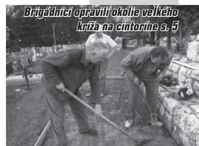
Brigádnicí opravili okolie veľkého kríža na cintoríne s. 5