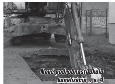
Nové podrobnosti okolo kanalizácie ... s. 4