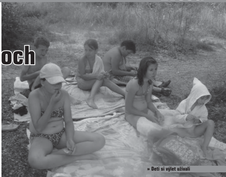
» Deti si výlet užívali

Najväčší hrdinovia, ktorí sa v noci najprv vôbec nebáli, po rozprávani o strigách na krížnych cestách, boli takí vystrašení, že nechceli ísť ani pred chatku. Plní zážitkov potom zaspali na tvrdej podlahe v spacákoch.