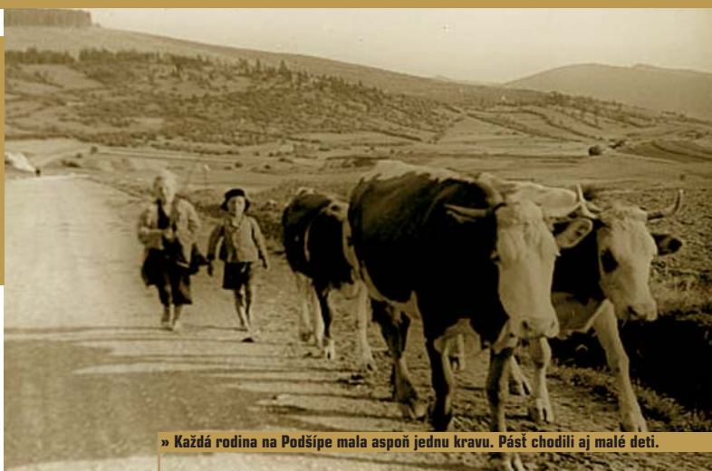
» Každá rodina na Podšípe mala aspoň jednu kravu. Pásť chodili aj malé deti.

Snáď každý hektár mal svoje pomenovanie. Uvedieme len niektoré: Uhliská, Košiare, Drgovo, Salaško, Kopanice. Klin, Vršok a Hradý boli najúrodnejšie. Tam sa dobre darilo zemiakom, jačmeňu, žitu, ľanu. Na Hradách bola vynikajúca kapusta, cvikla, ale pestovala sa aj koreňová zelenina, pretože sa tam dalo orať. V ďalších častiach chotára sa pracovalo motykami a maštalný hnoj sa vynášal v košoch na chrbtoch. Tam, kde sa nedalo