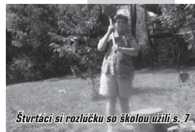
Štvrtáci si rozlúčku so školou užili s. 7