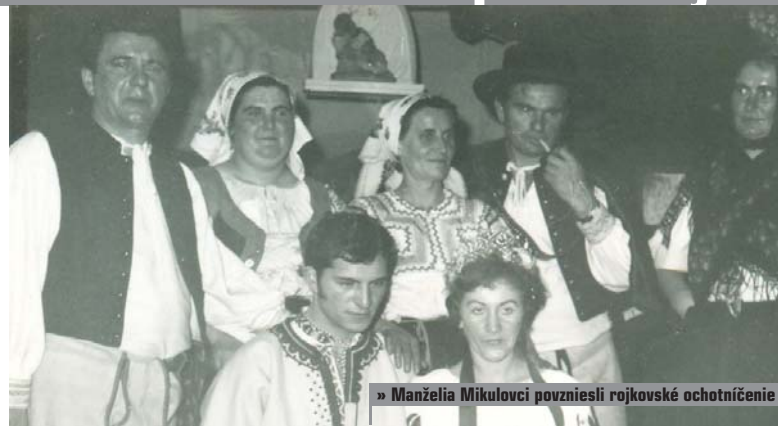
» Manželia Mikulovci povzniesli rojkovské ochotníčenie

Hlad po divadelnej kultúre je veľký, ostala len dieťa, ktorá sa dá ťažko zaplátať, no stále dúfame, že zlaté časy ochotníckeho divadla sa vrátia. Príde alebo sa vráti