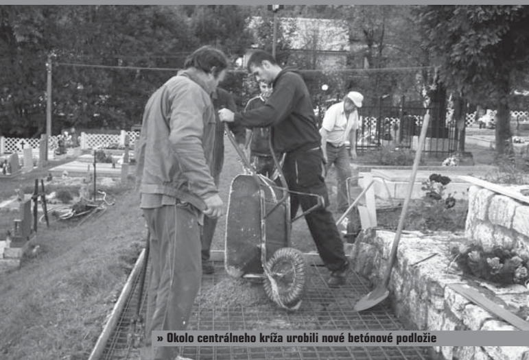
» Okolo centrálneho kríža urobili nové betónové podlažie