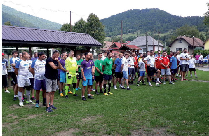
» Otvorenie turnaja o Bačov pohár