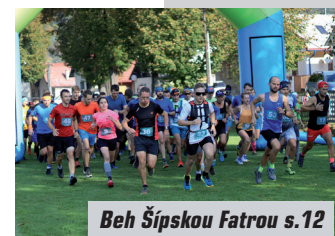
Beh Šípskou Fatrou s.12