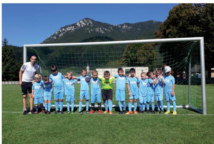
» Spoločné družstvo U-9 na súťažnom turnaji v Stankovanoch 16.9.2023

Turnaj mal opäť veľmi dobrú úroveň. Počasie vyšlo a tak si všetci mohli do sýtosti zahrať. Na všetkých