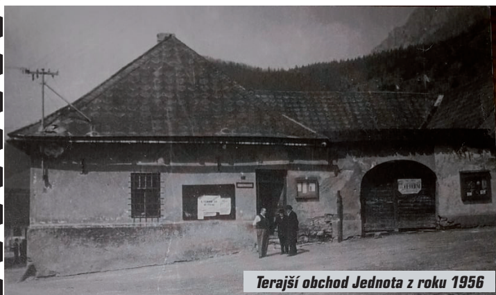
Terajší obchod Jednota z roku 1956