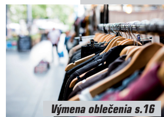
Výmena oblečenia s.16