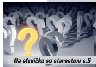
Na slovíčko so starostom s.5