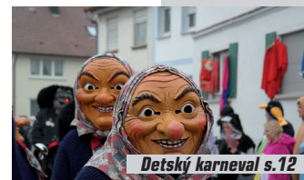
Detský karneval s.12