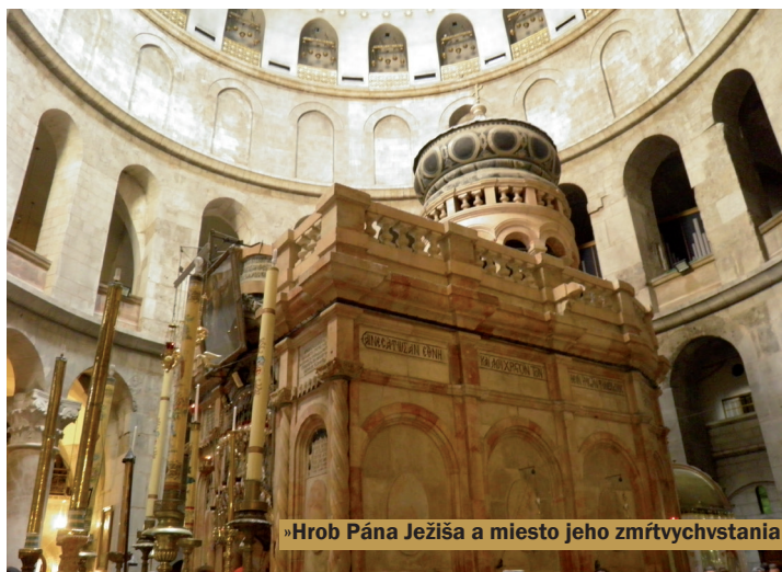
»Hrob Pána Ježiša a miesto jeho zmŕtvychvstania