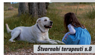
Štvornohí terapeuti s.8