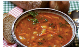
Súťaž vo varení kotlíkových gulášov s.8