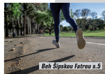
Beh Šípskou Fatrou s.5