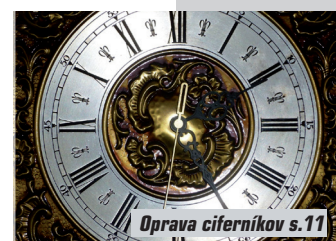
Oprava ciferníkov s.11