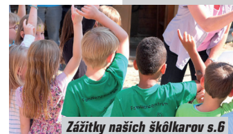
Zážitky našich školkarov s.6