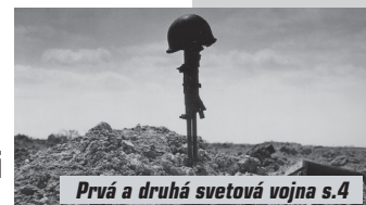
Prvá a druhá svetová vojna s.4

Majstrovstvá Slovenska v šachu mládeže s.10