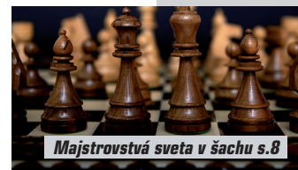
Majstrovstvá sveta v šachu s.8